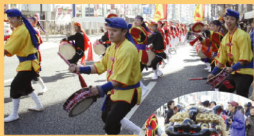
琉球國祭り太鼓 東京支部他出演